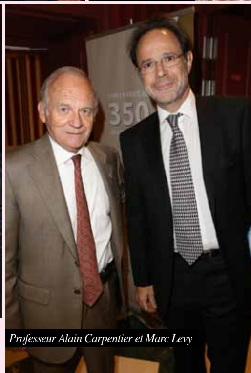
Professeur Alain Carpentier et Marc Levy