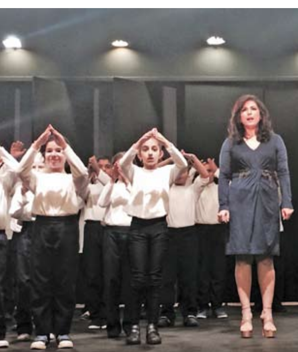
صور تلامذة «مدرسة تأهيل وتوجيه الصم» التابعة لجمعية رعاية النجم في صيدا (جنوب لبنان)، شريطاً مصوراً للشيد الوطني اللبناني بلغة الإشارة، بمشاركة السوبرانو اللبنانية هبة القواس وإشرافها. وحمل الفيديو الذي يُعرض على شاشات التلفزيون اللبنانية لمناسبة عيد الاستقلال، عنوان «الصلوات بحلي نشيد - كلنا لبعض كلنا للوطن»، وجاء في البيان الذي ورعته الجمعية: «يضيء هذا العمل معنى للفن في خدمة فئات ذوي الحاجات الخاصة في مجتمعنا وهو يدعو لتكون صوتاً واحداً في خدمة الوطن وللتعبير عن أن لكل إنسان في وطننا صوتاً يجب أن يسمع، بخاصة في عيد الاستقلال».

وقد شهدت حديقة جمعية رعاية النجم التابعة لجمعية الصم ومعلماتهم ومدربة لغة الإشارة والسوبرانو هبة القواس والفريق المصور. جميع تعاون لنادية النشيد بلغة الإشارة، فيما دُبح صوت هبة القواس الذي يعبر عن مسيرتها الفنية الملزمة بقضايا الوطن والفن الجميل والأعمال الإنسانية، مع أصوات الأطفال لينتج فيديو مشغولاً من القلب.